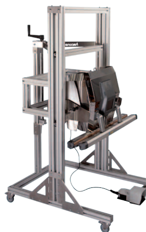
Magasságban állítható mobil állvány

A kiadványban szereplő termékek tulajdonságai és felhasználási javaslatai tájékoztató jellegűek, nem tekinthetők azok a termékekre vonatkozó műszaki leírásnak. A termékek legkisebb kiszerezési egységét az azokra vonatkozó egyedi szerződési rendelkezések határozzák meg. A nyomtatásban szereplő hibákért felelősséget nem vállalunk, a termékek jelen katalógusban feltüntetett műszaki tulajdonságainak megváltoztatási jogát fenntartjuk.