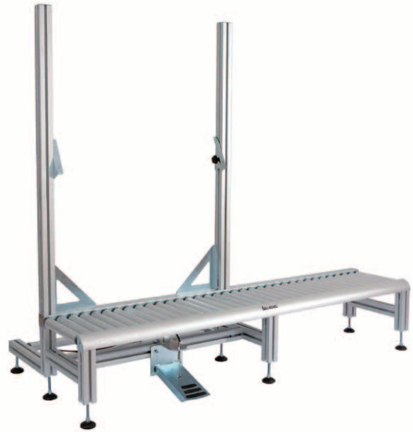
Bag Sealer görgőpálya